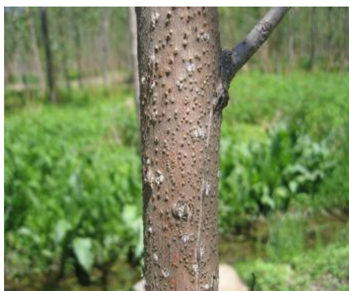
图A.6 杨树烂皮病症状1