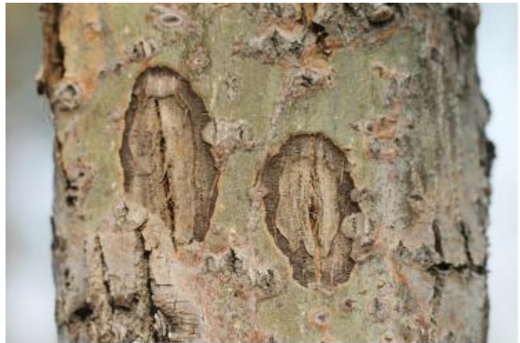
图A.9 杨树烂皮病防治后伤口愈合图