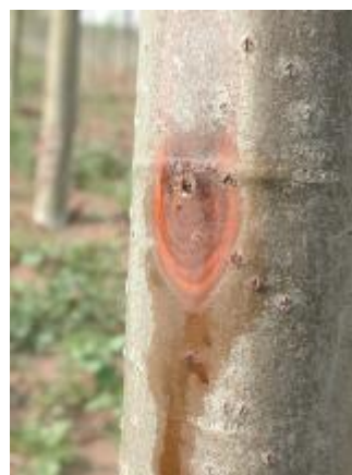
图 A.4 杨树烂皮病病斑 1