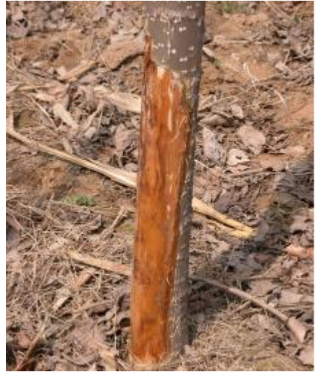
图A.8 杨树烂皮病症状3