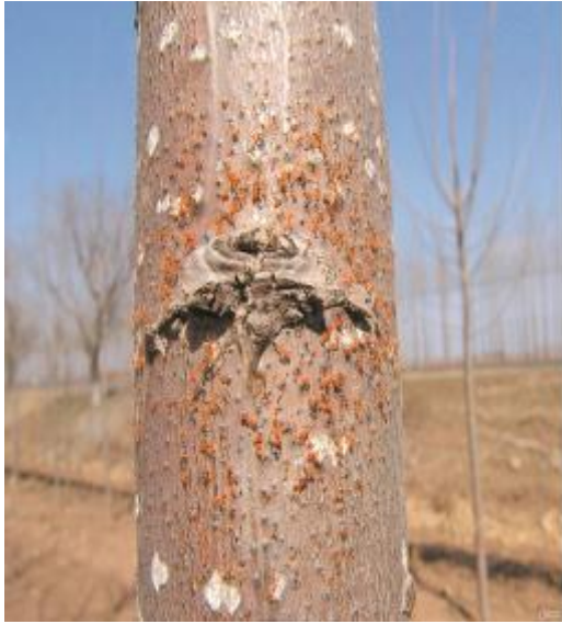
图A.7 杨树烂皮病症状2