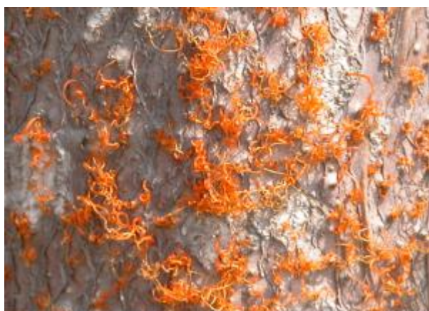
图 A.3 杨树烂皮病分生孢子角