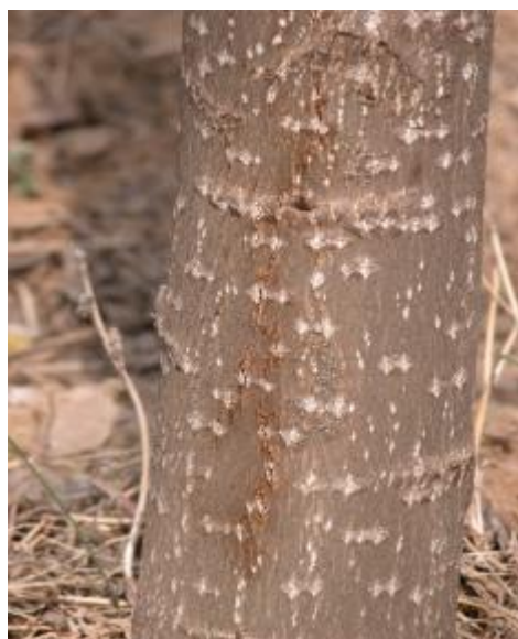
图A.5 杨树烂皮病病斑2